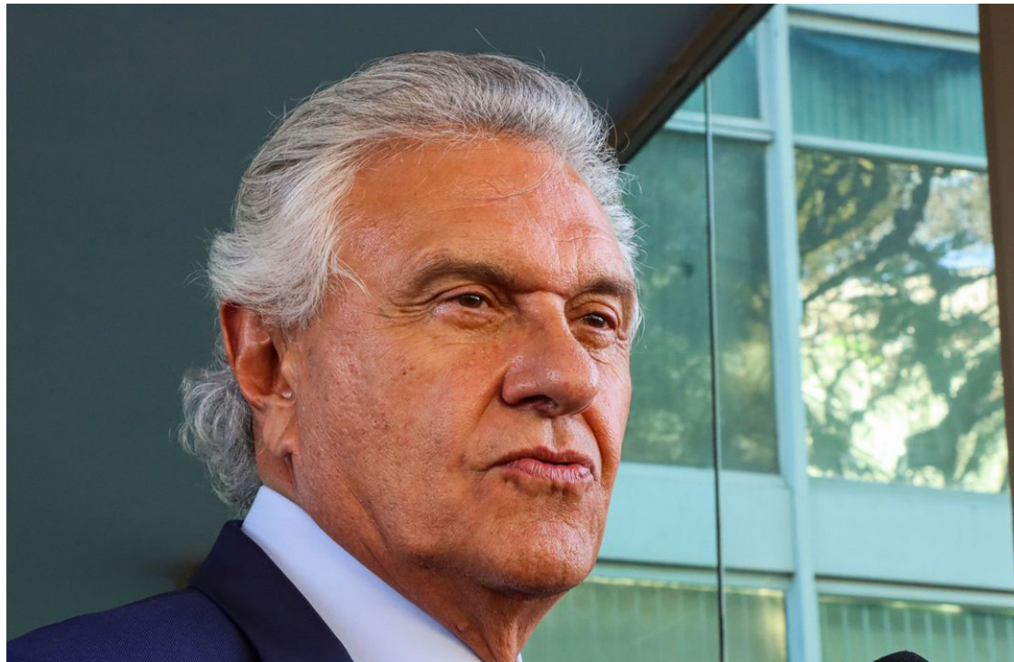
Ronaldo Caiado espera que novas mudanças sejam feitas no plenário do Senado Federal

Mais uma vez, o governador reforçou a importância de