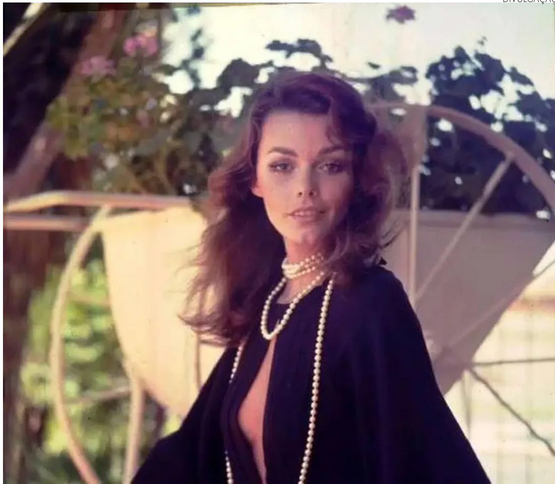
Ângela Diniz: Uma luta pela justiça que ainda não acabou

Ângela Maria Diniz, um nome que ecoa na história do Brasil, não apenas por sua tragédia pessoal, mas pelo impacto que teve na luta pelos direitos das mulheres. Ângela foi vítima de um feminicídio brutal em 30 de dezembro de 1976, quando seu então namorado, Doca Street, disparou três tiros em seu rosto e um na nuca, tirando-lhe a vida aos 32 anos, em Búzios, Rio de Janeiro, deixando para trás três filhos.