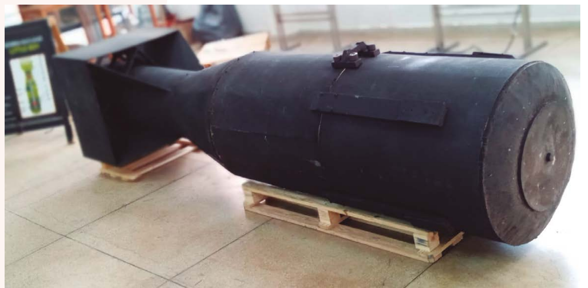
Réplica da Little Boy, bomba atômica lançada pelos EUA sobre Hiroshima, no Japão, em 6 de agosto de 1945