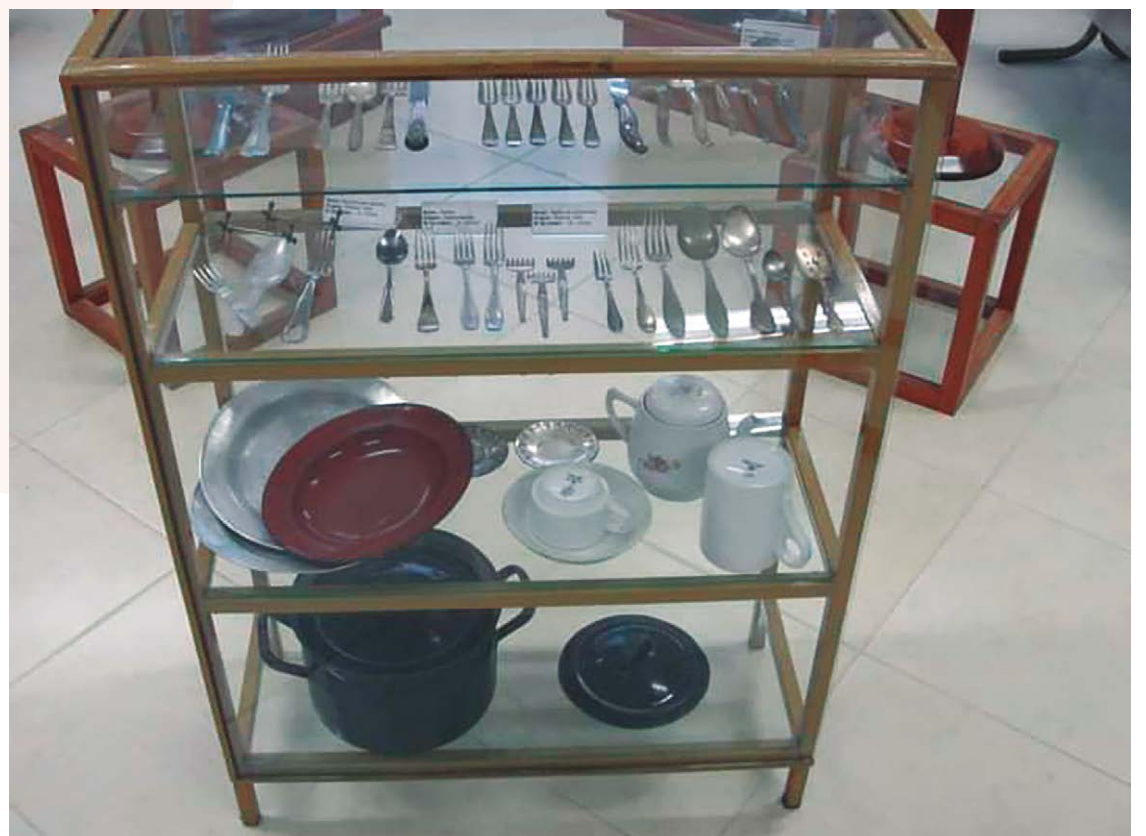
Famílias compartilham objetos e relíquias de antepassados para compor o acervo em exposição no Ceitec

No dia 6 de agosto de 1945, os Estados Unidos jogaram uma bomba atômica sobre a cidade de Hiroshima - foi a primeira vez que esse tipo de arma foi utilizado na história.