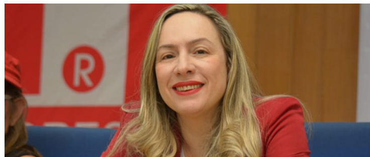
Adriana Accorsi: primeiros passos na pré-campanha