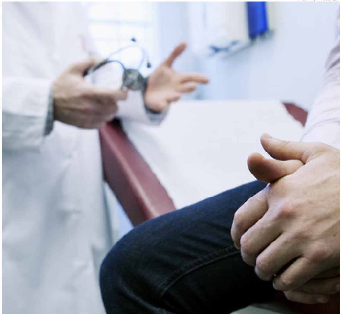
Novembro Azul desempenha papel importante ao chamar a atenção dos homens para a importância da realização de exames regulares

A campanha em tela, se torna fundamental na luta contra o câncer de próstata, ela é um lembrete para que os homens compreendam a necessidade de se envolver ativamente na busca pelo seu bem-estar. O "Novembro Azul", portanto, desempenha um papel vital na promoção da saúde dos homens, o melhor caminho sempre será o do monitoramento para prevenção!