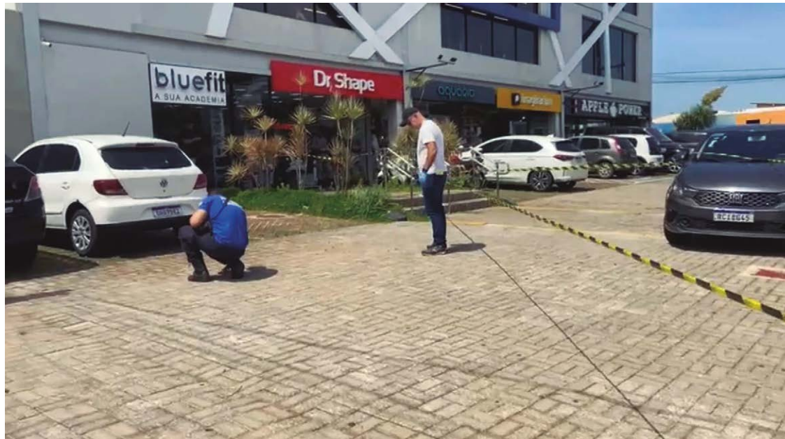
Carro do personal trainer, em frente à academia, recebeu pelo menos 29 disparos na manhã de segunda, 6