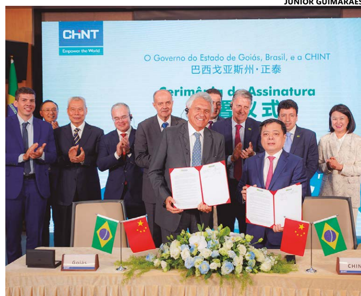
A formalização do acordo aconteceu nesta terça-feira, 7, em Xangai, na China; parceria tem o objetivo de buscar geração de emprego e renda

Fundada em 1984, a Chint está presente em negócios em mais de 140 países e regiões. São 30 mil colaboradores associados à empresa que, em 2018, alcançou o montante de US$ 10,5 bilhões em vendas anuais. O feito colocou a organização na lista das 50 principais da Ásia e entre as 100 maiores empresas privadas da China. (Com Secom/GO)