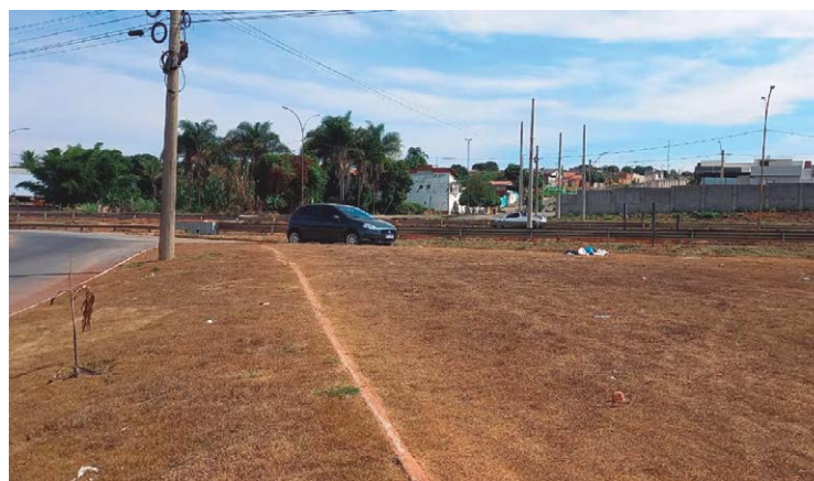
Neste ponto deve ser construído o novo viaduto, que é essencial para a ligação de dois grandes setores da cidade e para dar fluidez ao tráfego

A Prefeitura elaborou e entregou os projetos executivos para que fossem aprovados pela