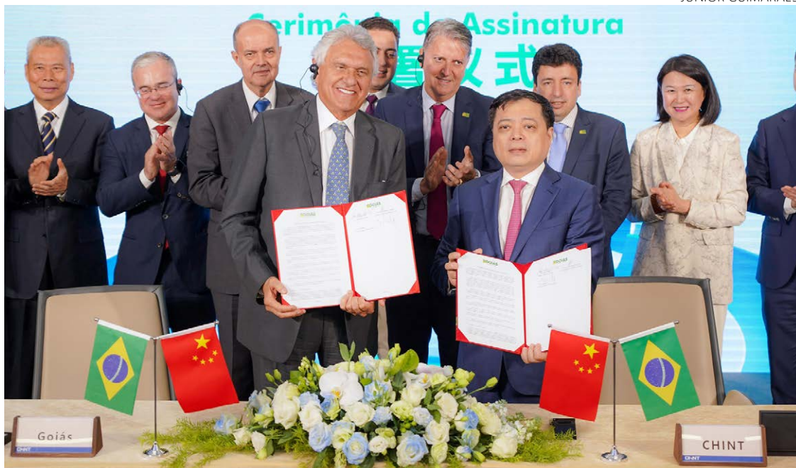
Governador Ronaldo Caiado fecha acordo para instalação de multinacional chinesa em Itumbiara

“Nossa vinda aqui tem um objetivo: fazer com que possamos ampliar os investimentos de empresas de tecnologia em