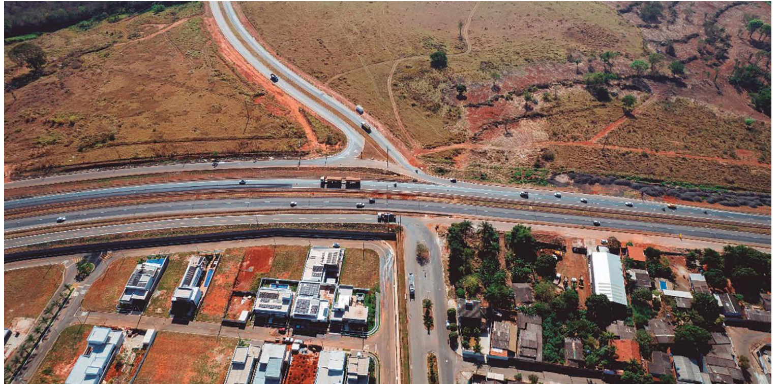
Decisão inesperada da concessionária Ecovias do Araguaia atrasa obra do viaduto que, depois de concluído, deve beneficiar mais de 60 mil pessoas

Prevista no programa "Anápolis Investe", a obra do viaduto do Recanto do Sol já estava prestes a iniciar, com ordem de serviço já agendados para o mês que vem. Porém, um ofício enviado nesta terça-feira, 7, pela Ecovias do Araguaia, pegou de surpresa os técnicos da Secretaria Municipal de Obras. No documento, a concessionária pede alterações no projeto que nunca haviam sido discutidas antes. "Dezenas de reuniões foram feitas entre os técnicos da Prefeitura e os técnicos da Ecovias. Eles nunca falaram sobre estas mudanças no projeto. Nós licitamos a obra